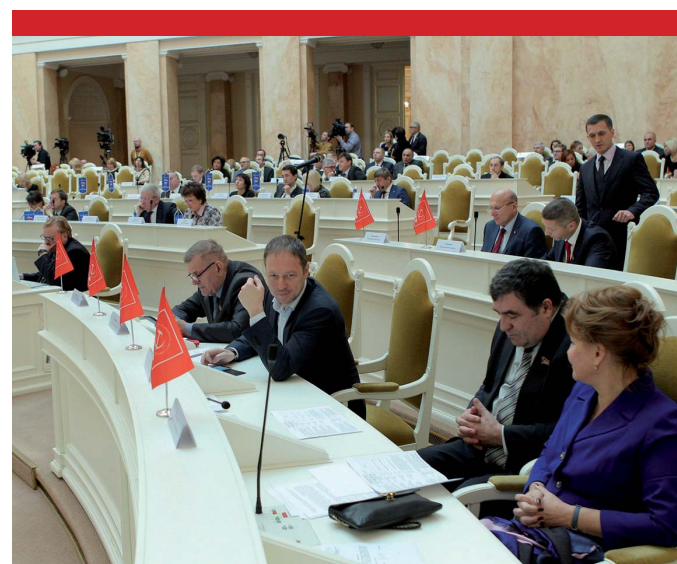
Фракция КПРФ на Пленарном заседании Законодательного Собрания